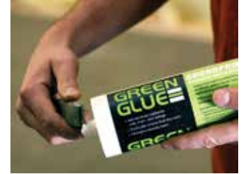
Paso 2: Corte el extremo del tubo

Escanee el código QR para ver cómo aplicar el compuesto de insonorización Green Glue