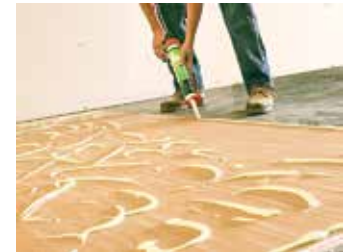
Paso 3: Aplique en orugas grandes

Corte el extremo del tubo como se muestra en la imagen superior derecha. Atornille la boquilla separada y corte el extremo dejando una abertura de 3/8" o más.