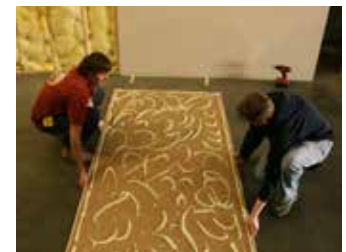
Paso 4: Levante la tabla

Aplique Green Glue a la segunda placa de yeso sobre una superficie limpia y plana. Aplique el pegamento en orugas en un patrón aleatorio a lo largo de toda la tabla. Deje un borde de 2-3" sin Green Glue alrededor del borde de la tabla. Esto permitirá un mejor manejo de la tabla. Use 2 tubos por cada lámina de 4'x8'.