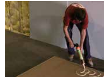
Paso 3: Aplique Green Glue

Cuelgue la primera capa de placa de yeso. Después de colgar la primera capa de placa de yeso, se recomienda sellar las uniones entre las láminas. Esto se puede hacer con barro de yeso. Usando sellador de insonorización, tenga cuidado de no usar una oruga tan grande que sobresalga fuera del plano de la placa de yeso, lo cual impediría que la segunda capa se asiente plana. Si la velocidad es un problema, puede omitir este paso escalonando las uniones entre la primera y segunda capa de placas de yeso. Selle el perímetro después de instalar la última placa de yeso.