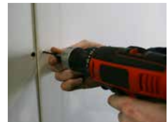
Paso 4: Asegúrela en su lugar

Después de aplicar Green Glue en la parte posterior de la segunda capa, levante la tabla para colocarla en posición, presione la tabla contra la pared o el techo y fíjela en su lugar con los tornillos adecuados. Green Glue se exprime en una capa delgada (alrededor de 0,5 mm). La segunda capa debe ser colgada y atornillada dentro de 15 minutos para evitar que Green Glue se seque antes de que esté en su lugar. La distancia típica de los tornillos es de 16" centro a centro para las paredes y de 12" centro a centro para los techos, pero asegúrese de seguir todos los códigos de construcción locales correspondientes con respecto al tipo de tornillos y la distancia entre ellos. Utilice nuestro sellador de insonorización Green Glue para sellar el perímetro y alrededor de los tomacorrientes, prestando especial atención a la grieta donde la placa de yeso se une con el piso para que no se peque ni se ensucie.